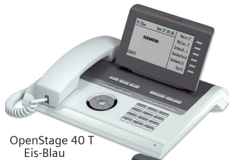
OpenStage 40 T Eis-Blau