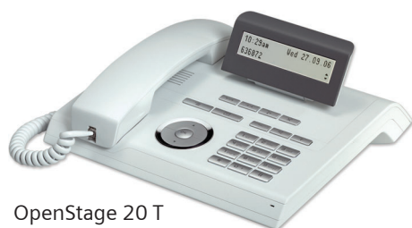
OpenStage 20 T Eis-Blau