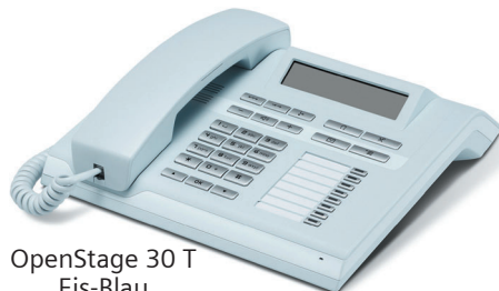
OpenStage 30 T Eis-Blau