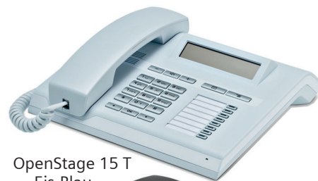
OpenStage 15 T Eis-Blau