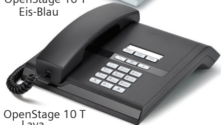
OpenStage 10 T Lava