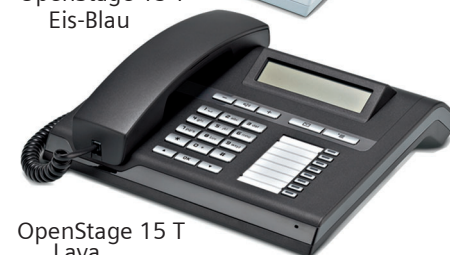
OpenStage 15 T Lava