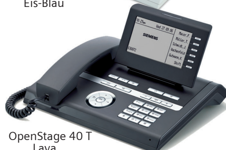
OpenStage 40 T Lava