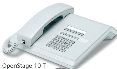
OpenStage 10 T Eis-Blau