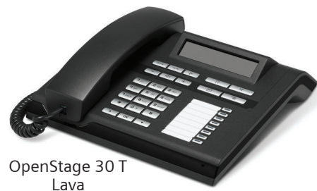
OpenStage 30 T Lava