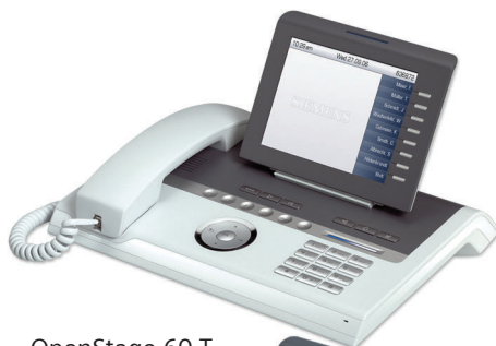
OpenStage 60 T Eis-Blau