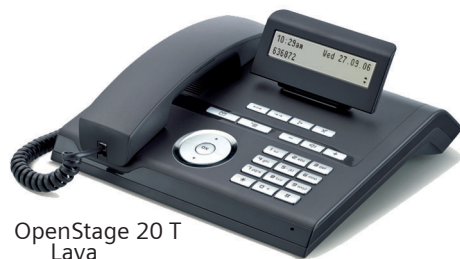
OpenStage 20 T Lava