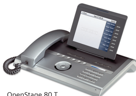
OpenStage 80 T